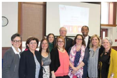
Table ronde Femmes et politique

Le 26 mars 2019, AGIR a organisé une table ronde avec les membres des comités mixtes du projet Défi parité ainsi que des membres du Comité de coordination avec la participation du député fédéral de Hull-Aylmer, monsieur Greg Fergus.